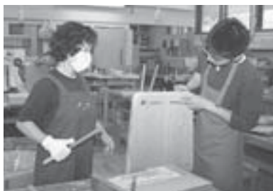
▲難しい所は専門員と一緒に