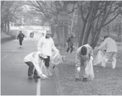
みんなが気持ち良く使用できるように、雨の中でも、熱心に清掃活動を行っています。

厚別南地区を横断する札幌恵庭自転車道路（白石サイクリングロード）は、大切な地域資源として多くの市民に親しまれています。 また、同地区にとってサイクリングロードは、生活道路や通学路として生活に密着していて、地元町内会などが、春と秋の清掃活動や、自主パトロール、警察と連携して通学路の見守り活動などを行ってきました。 昨年十月に発足した厚別南地区まちづくり会議では、人と自転車の接触防止や、夜間の防犯上の問題などについてさまざまな議論を行ってきました。また、自転車利用者や歩行者のマナーについても多くの意見が出ていることから、同会議では住民が安心して利用できるサイクリングロードの環境を提言していくために「サイクリングロードを考える会」を発足させました。