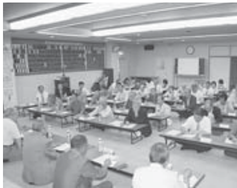
第3回厚別南地区まちづくり会議で、サイクリングロードについて議論しました。

厚別南地区を横断する札幌恵庭自転車道路（白石サイクリングロード）は、大切な地域資源として多くの市民に親しまれています。 また、同地区にとってサイクリングロードは、生活道路や通学路として生活に密着していて、地元町内会などが、春と秋の清掃活動や、自主パトロール、警察と連携して通学路の見守り活動などを行ってきました。 昨年十月に発足した厚別南地区まちづくり会議では、人と自転車の接触防止や、夜間の防犯上の問題などについてさまざまな議論を行ってきました。また、自転車利用者や歩行者のマナーについても多くの意見が出ていることから、同会議では住民が安心して利用できるサイクリングロードの環境を提言していくために「サイクリングロードを考える会」を発足させました。