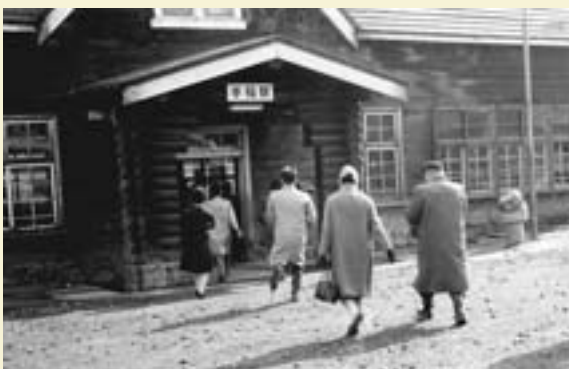
木造だった頃の手稲駅舎▶