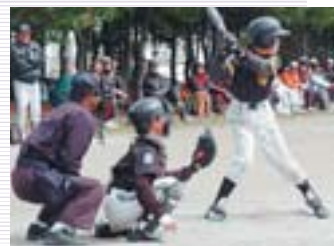
ファイターズカップ豊平区予選の様子

ファイターズカップという、ファイターズ主催の少年野球大会もあります。全市のチームで優勝を争い、準決勝戦と決勝戦は札幌ドームで行われます。ドームで試合をするという経験は、少年野球ではなかなかできないことなので、子どもたちもとても張り切って練習しています。