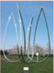
11 開く花 (伊藤隆一)