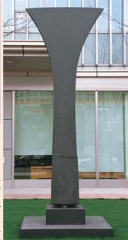
7 デアイバチ (流政之) 北8西3・JR札幌駅から徒歩約2分

昨年九月十月北海道立近代美術館にて世界的に有名な流政之さんの個展が開催されました。その出展作品の一つがJR札幌駅北口向