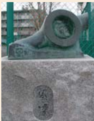
（←）②風雪碑（坂垣道） 北24西8・地下鉄北24条駅から徒歩約8分 札幌飛行場正門跡の門柱と坂さんのアトリエも同住所 アトリエの門にも作品（↓）