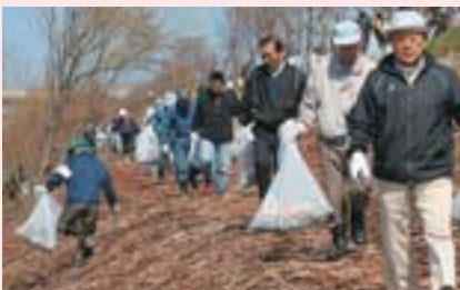
4/24 さくら並木クリーン作戦