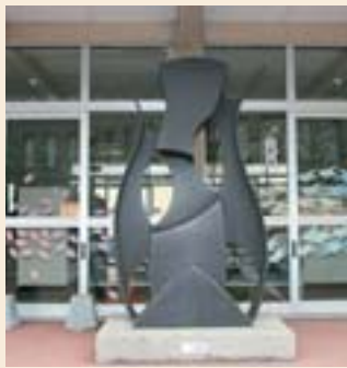
6 MUSE # 2 (國松明日香) 北9西1 北九条小学校・地下鉄北12条駅から徒歩約5分

文化がはぐくまれることを願いギリシャ神話で学問をつかさどる九姉妹の女神MUSEを象徴的に表現し、平成十五年には「日本の鉄道」パブリックアート大賞「優秀賞」を受賞しました。この四月から同地区で試行されている地域通貨の単位にもMUSEが使われるなど街の人たちに親しまれています。またJRあいの里公園駅前では、MUSEの中で歴史をつかさどる女神「KLEIO」をモチーフにした彫刻を見ることが出来ます。