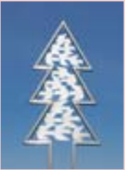
10 北の森たち (伊藤隆一)