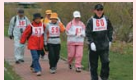
5/8 さくら並木を歩く会

新川さくら並木の完成を記念して開催している「新川さくらフェスティバル」。新川連合町内会の人たちが中心となって、自分たちで植えた桜並木をきれいにしようとごみ拾いをしたり、川を眺めながらのんびりと散策して楽しんだりして、春の訪れを感じていました。音楽祭では桜並木にかかわる活動を紹介し「新川さくら並木のうた」を合唱。この素晴らしい景色を、一人でも多くの人たちに見てほしいとの願いが込められたフェスティバルでした。