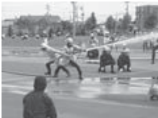
▲高度な消防技術を披露