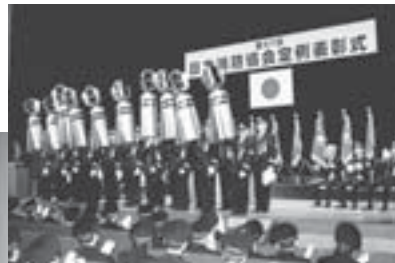
▲2月10日に東京で行われた表彰式