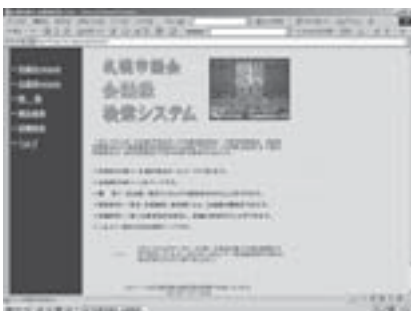
市議会ホームページアドレス(右上)にアクセスを

市議会の会議録検索システムでは、過去の本会議や予算・決算特別委員会での会議録を検索することができます。また、今年度から、各常任委員会と調査特別委員会の会議録も検索できるようになりました。