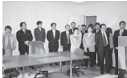
↑札幌少年鑑別所を視察する少子化対策・青少年育成調査特別委員 →白石清掃工場を視察する環境消防委員