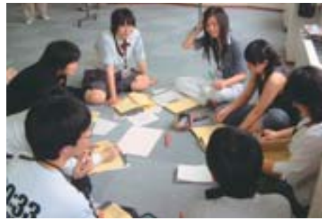
▲区での研修会を支えるスタッフとして、熱心に話し合うジュニアリーダー上級研修生たち

子ども会では、子どもたちみんなで話し合っ行って行事の計画を立て、準備を進めています。その中で、意見の取りまとめなど中心的な役割を担うのがジュニアリーダーです。ジュニアリーダーになれるのは、それぞれの子ども会から推薦された小学五年生以上の子どもたち。実際にジュニアリーダーとして子ども会の活動を引っ張る傍ら、年に数回開かれるキャンプ研修やボランティア研修などの研修会