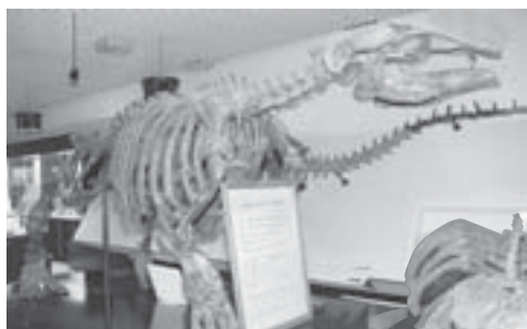
↑デスマスティルス カセキ の化石

みんなは北海道大学の構内に博物館があることを知っているかな。ここには、大学の歴史や研究内容を紹介する展示のほか、さまざまな生物の化石や昆虫の標本、ロケットなどが展示されているんだよ。その一部を紹介するね。