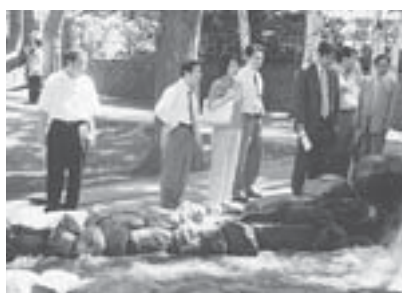
所管施設を視察する建設委員 ～サクシユ琴似川

サクシユ琴似川(北区北8西7)、手稲北口駐輪場(手稲区前田1の11)を視察しました。