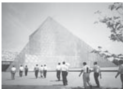
所管施設を視察する環境消防委員 ～モエレ沼公園