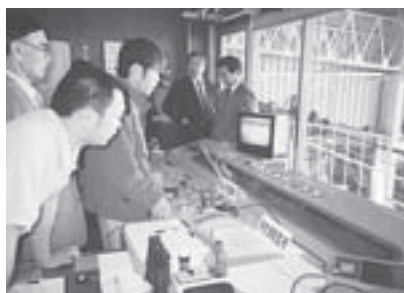
所管関連施設を視察する経済公営企業委員 ～藻岩山ロープウェイ