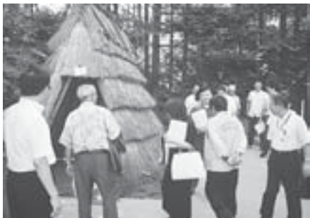
所管施設を視察する総務委員 ～アイヌ文化交流センター

「札幌市内(石狩第一～五学区)公立高等学校の『間口削減』に反対する陳情」、「札幌市内の公立高等学校の間口削減に反対する陳情」の初審査を行い、継続審査としました。