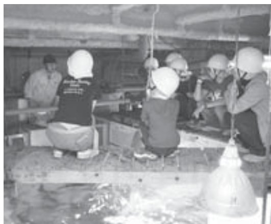
ウラ側探検隊が1階の回遊水槽を上から見学しています。ここからエイの餌付けを見学しました。

サンピアザ水族館は、海に接していない札幌市に設置された、道内では初めての内陸・都市型水族館です。青少年科学館との相乗効果により副都心に社会教育ゾーンを作る計画で、昭和五十七年に開館しました。比較的小さい施設の中で、たくさん生き物を飼育できるような水槽の配置を効率的にし、市民に何度も見てもらえるよう展示方法に工夫を凝らしています。海水は、週一回、苫小牧から輸送し、淡水の生き物にはカルキ除去などの処理をした水道水を使っています。