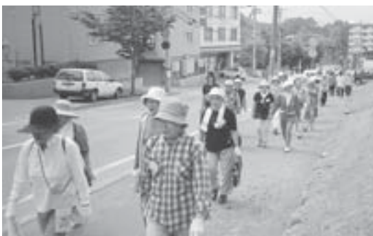
▶ 地域健康づくりサポーター研修でのウォーキング

ォーキングマップ」を製作しました。マップでは、区内のお薦めウォーキングルートを見所とともに紹介しています。マップの製作は、地域健康づくりサポーター研修の中で行われました。この研修は、地域に根ざした自主的な健康づくり活動を展開するために、平成11年から開催しています。昨年度に受講した地域健康づくりサポーター52人が、6月から9月にかけて地区ごとに歩いてコースや見所の選定を行い、その後、地区を代表する14人の編集委員が、校正作業などマップ全体を編集しました。