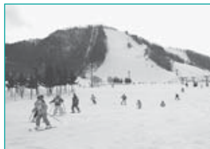
◀気軽にできますスノースケート