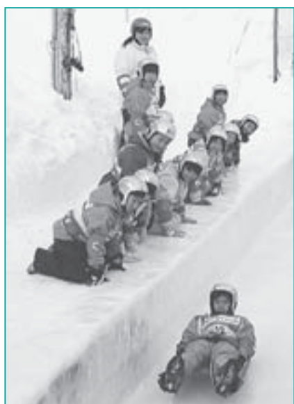
▲迫力あるリージュの滑り

国内でもう1カ所のオリンピックが行われた長野や世界の主なコースは、機械でコースを冷やして造ります。このように、Fu'sのコースは特徴あるコースです。