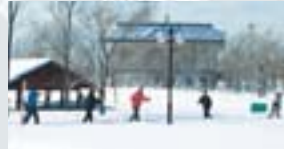
雪景色も楽しめる歩くスキー (サッポロさとらんど)

スキーやスケートなどのウィンタースポーツが好きな方にとっては、冬が待ち遠しかったのではないでしょう。東区にはスキー場はありませんが、美香保体育館は、十一月から四月までの間、スケートリンクとして利用されています。