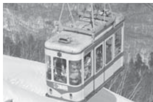
▲最終日は多くのファンやスキーヤーが訪れました