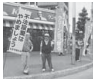
昨年7月、円山第12町内会が街頭で行った、『ポイ捨てごみゼロキャンペーン』の様子

役員によるごみステーションの点検など。三年間の地道な活動により、年々住民の皆さんの意識は高まり、今ではほとんどのごみステーションで、マナー違反が見られなくなつたそうです。また、春には、家族で花壇作りを楽しんでもらおうと、花の苗を各家庭やマンションに配つたり、秋には落ち葉拾いを行いました。