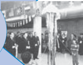
▼開通式のテープカット

3月、地下鉄南北線北24条-麻生間が開通。大通-麻生間が約11分で結ばれ、より便利に