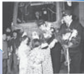
▲感謝の気持ちが入められた花束贈呈

1月、区民の文化活動の拠点となる区民センターが、市内で最初にオープン。北保健所も併設される