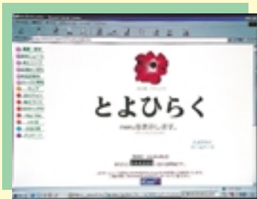
現在のホームページ

トップページ（表紙）には、区の花であるペチュニアを配置。区の概要・歴史や区内のニュースのほか、区役所案内や広報さつばる区民のページなども見る