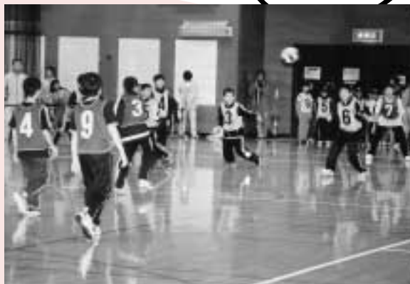
▶好プレー続出に、会場は沸き立ちます