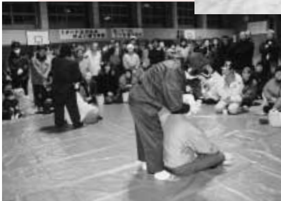
▲応急処置訓練。みんな、真剣に見入っていました

一月十六日、震度六強の地震を想定した「大規模災害対応訓練」が、区役所と厚別通小学校、厚別中学校を会場に行われました。 避難場所となった厚別通小学校では、約百人の区民が参加。避難所運営訓練や非常食を使った炊き出し訓練などを行い、防災に対する意識を高めていました。