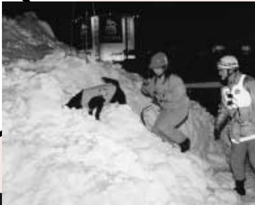
▲雪山から被災者を救助する訓練では、救助犬も出動