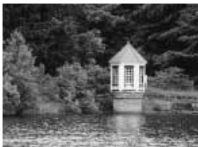
登録有形文化財に選定されたかわいらしい取水塔

西岡公園内にある水源池は野鳥や虫、トンボなどが観察できる自然の宝庫として、また、四季折々に散策が楽しめる憩いの場所として、市民に親しまれています。その一角にある赤いトンがり屋根で六角形の愛らしい木造建築物が、人目を引きま。この建物は取水塔と呼ばれ、およそ九十年前の明治四十二年(四十三年との説もある)に建てられた、市内で最も古い水道施設です。取水塔は、かつての月寒水道(本誌平成十三年十二月号で紹介)の名残で、当時月寒にあった旧陸軍第七師団歩兵第二十五連隊への給水を主な目的として造られたものです。