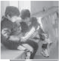
◀新発寒地区センター図書室