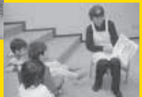
夢中になって聞いている子どもたち

ことができます。また、市内に希望の本がなかった場合、新たな購入のリクエストを受けたり、ほかの市町村の図書館が所有している本を取り寄せたりして、できるだけ皆さんにお貸しできるようにしています。そのほか、曙図書館では、毎月定期的な「楽しいお話会」(毎月四回。第一、第三土曜日の午後二時三十分から、第二、第四水曜日の午後三時から、いずれも約三十分間。右の囲み記事を参照)や、「映画会」(毎月二回。第一、第三土曜日の午後三時五十分から、約三十分間)といった楽しい催しも行っています(今月の詳しい内容は、手稲区民のページ6ページの曙図書館からのお知らせを参照)。小さなお子さんでも楽しむことができますので、どうぞ一度、足を運んでみてください。