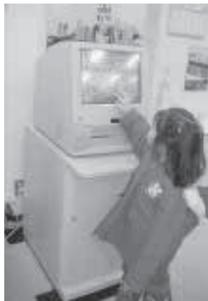
◀気軽に本を探せます

利です。内には二台設置されている利用者用の図書検索機を使って、読みたい本を自分で探すことができます。操作は、タッチパネル式の画面に指で触れるだけで、本の名前や、著者、ジャンルなどから検索ができて、とても便利