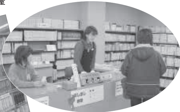
▲手稲コミュニティセンター図書室