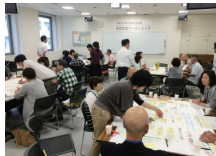
市民参加ワークショップの様子