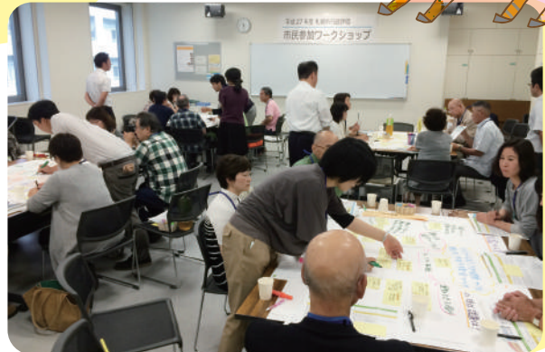
市民参加ワークショップの様子