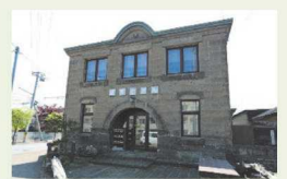
ぼすとかん（旧石山郵便局）

4万年前に支笏湖ができた時の火山活動で流出された火砕流の堆積物が固まった石材で、柔らかく加工しやすいのが特徴です。ぼすとかん（旧石山郵便局・石山2条3丁目1-26）は、札幌軟石を使った石山区のシンボリックな建物です。