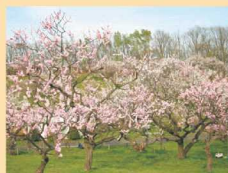
平岡公園 約1,200本もの梅が例年5月上旬~中旬に見頃を迎えます

以下は広告です(広告に関するお問い合わせは株式会社サイネックス ℓ011-737-7167へ)