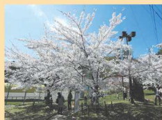
円山公園 エゾヤマザクラなど約120本の桜が咲きます

札幌では、桜も梅も同じ時期に開花し、4月下旬~5月中旬が見頃です。桜は円山公園(60☎)が有名で、毎年多くのお花見客でにぎわいます。梅は平岡公園(60☎)の梅林が見え。6.5㍉の敷地内に白とピンクの梅の花が咲き誇ります。