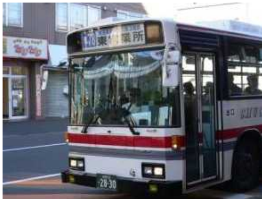
前面での行き先表示（幕）