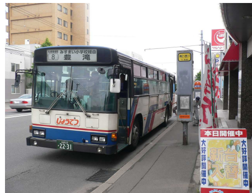
前面での行き先表示（幕）