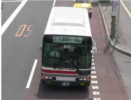
前面での起終点表示（幕）

近年は、表示内容の設定が柔軟なLED（発光ダイオード）式の方向表示車両も増えている。