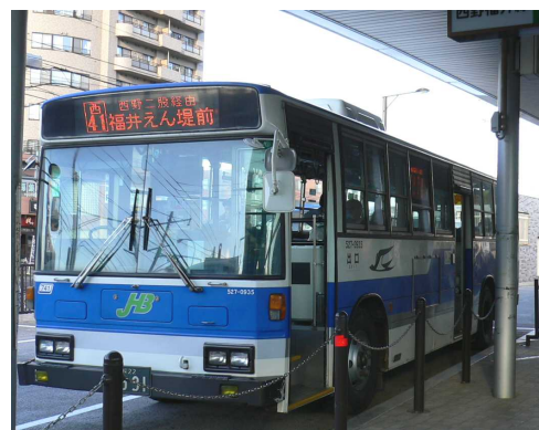
前面での行き先表示（LED）