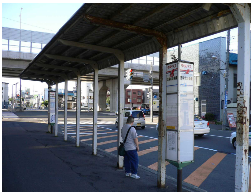
図 2.2-11 北 34 条駅バス乗り場の例