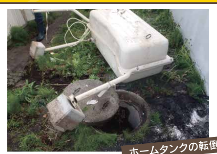
ホームタンクの転倒

ホームタンクについてのご相談は、 予防部査察規制課又はお住まいの区の消防署予防課へご連絡ください。