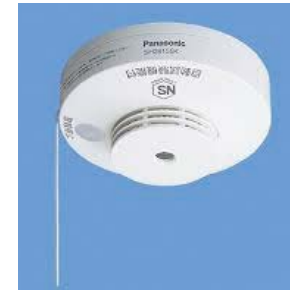
住宅用火災警報器