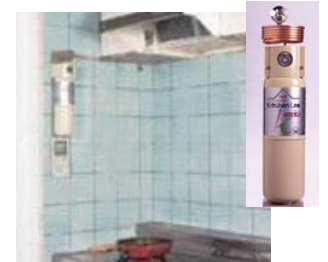
住宅用自動消火装置