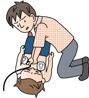
反応がない場合、ただちに心肺蘇生を開始