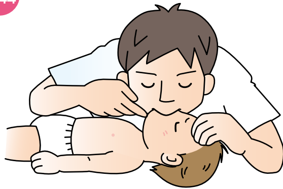
乳児への人工呼吸（口対口鼻人工呼吸）