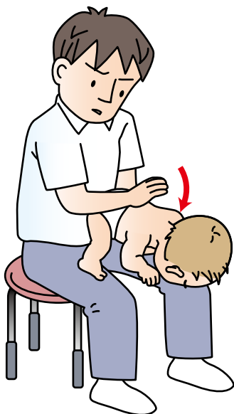
乳児への背部叩打法