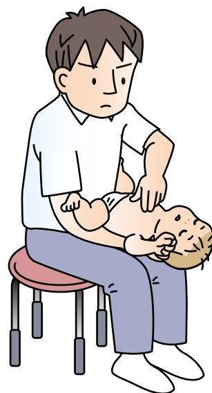
乳児への胸部突き上げ法