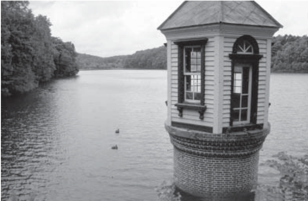
給水塔が残る西岡水源池。今は市民の憩いの場になっている