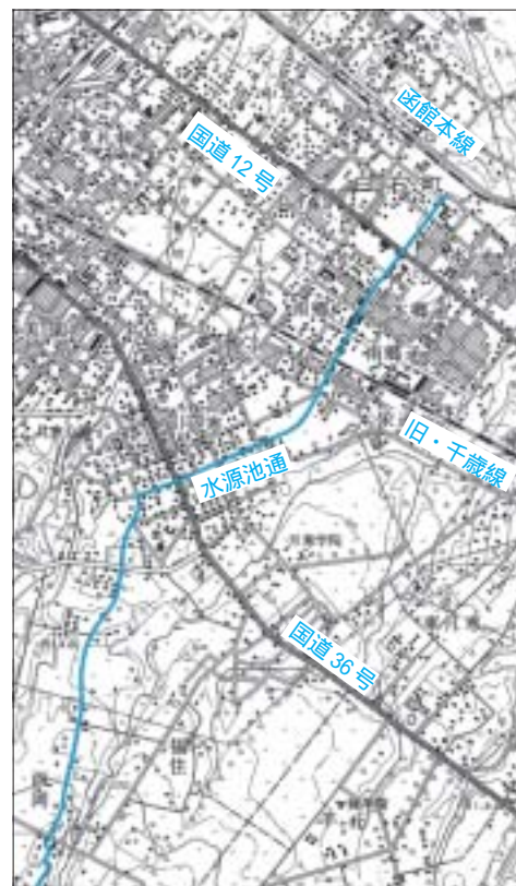
昭和40年の5万分の1地形図(部分拡大) 時代が進むにつれて水源池通が延びているのがわかる