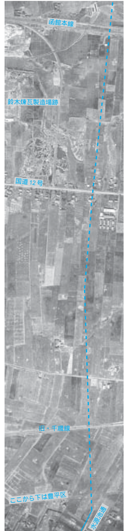
昭和23年頃米軍撮影の航空写真に現在の水源池通の位置を示したが、道は豊平までしかない