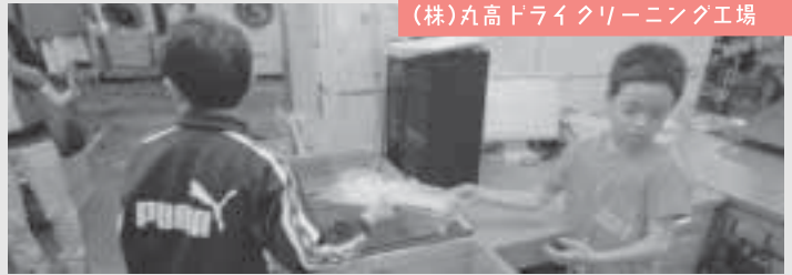
(株)丸高ドライクリーニング工場