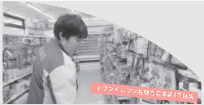
セブンイレブン札幌白石本通2丁目店