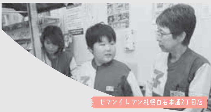
セブンイレブン札幌白石本通2丁目店

今回紹介した小・中学校の他にも各学校独自で「でっち奉公」を実施しています。一例として、白石小学校の実施内容を紹介します。