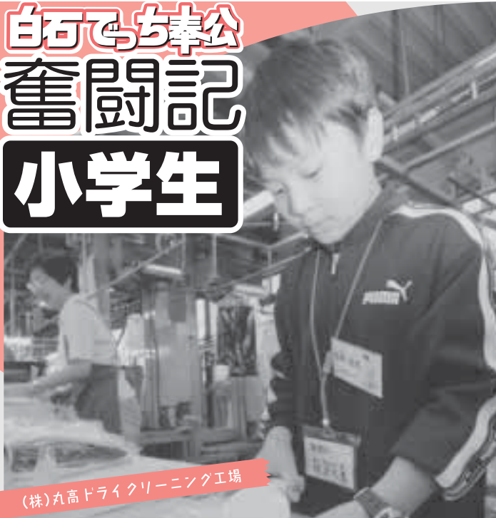
(株)丸高ドライクリーニング工場