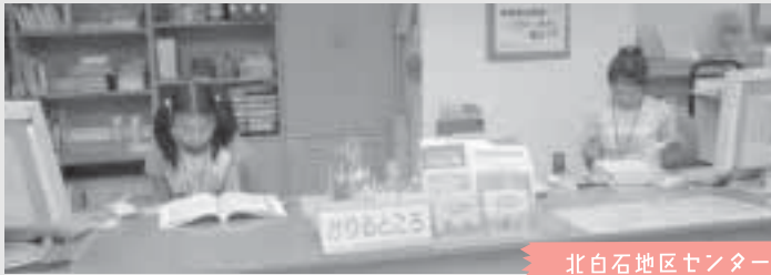
北白石地区センター