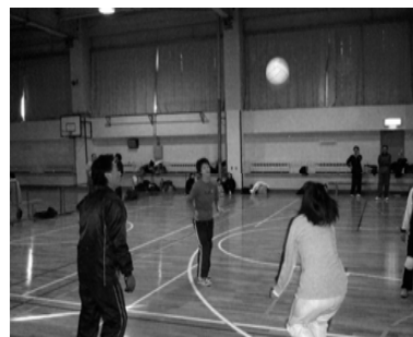
取材担当：長井和幸