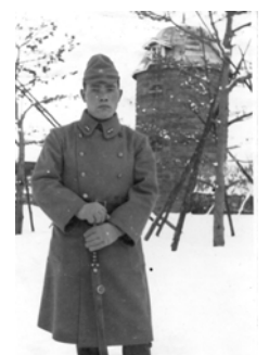
昭和17年当時の兼子さん