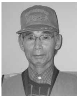
三上白石東青色パトロール隊隊長

既に 15 回のパトロールを行っています。子供たちも学校から教えられているため、車を見ると多くの子が笑顔で手を振ってくれたり、中には「おじさん！！」と親しげに声をかけてくれる元気な子や、我々が赤信号待ちしているとわざわざ車の前まで走り寄り、車の前に立ち止まってボンネットに手をかけ最敬礼してくれる子、あるいは家の前でお母さんが子供の帰りを待っている姿などを見かけることもあります。このような時はとても元気をもらい青パトをしていて良かったと思います。