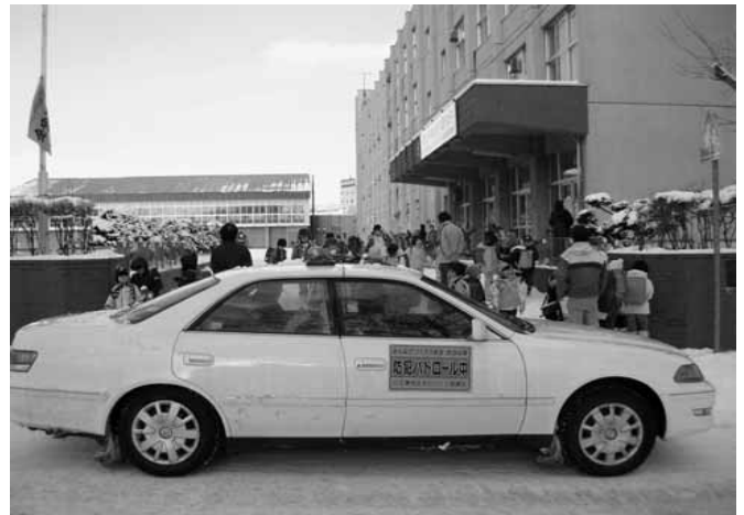
大谷地小学校の下校風景