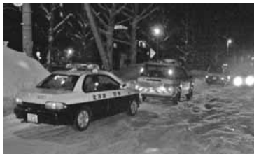
パトロールは警察、土木センターなどの協力を得て実施されました。

2月21日午後7時、栄通19丁目にある冒険公園に町内会の人々、白石区職員及び白石警察署員の総勢12名が集合し、国道12号線より南側一帯をパトロールし、違法駐車警告ステッカーを貼っていきました。