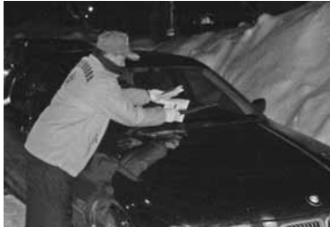
寒い中ご苦労様です。