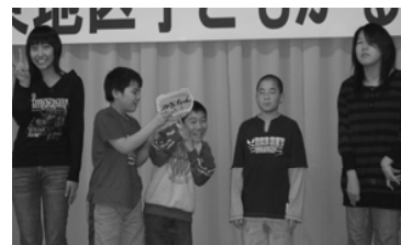
優勝したみさちゃんチーム