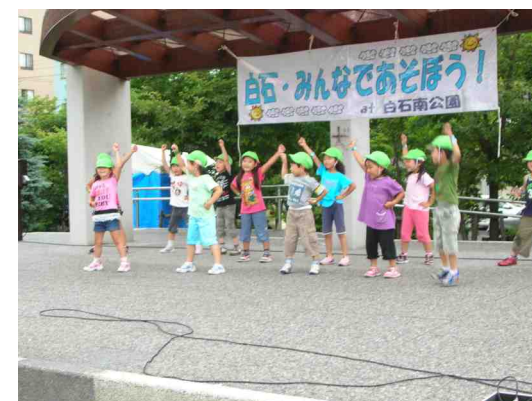
元気いっぱい踊る園児さんたち

「しろっぴー」も今年は一回しか出番がありませんでしたが、子どもたちは大喜びで一緒に写真を撮っていました。