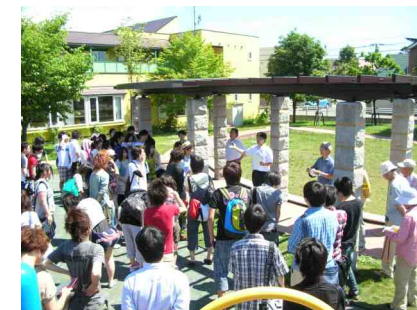
A-ブロックでの開始前の説明(白石東公園)

この取組は、平成20年の洞爺湖サミットを機に白石東地区の環境美化を目的として白石東町内会連合と札幌商工会議所附属専門学校の共同開催で始められたものです。町内会の方々、教職員、生徒さんたちが参加し約500名でスタートしたこの事業も3年目となり、今年は、総勢約720名の参加となり地区の1大事業として成長しています。