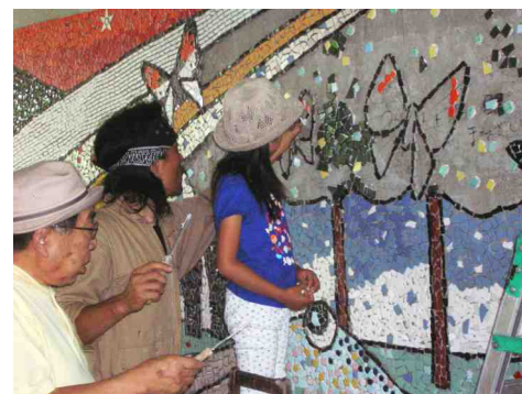
大人も子供もみんな一緒に

このタイルアートによる壁画制作は、地域の大人と子供が触れ合う大変良い機会でした。