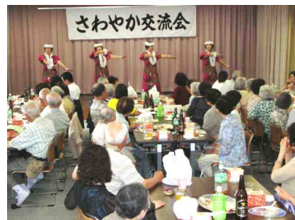
フラダンスを鑑賞するみなさん