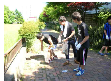
一生懸命にゴミを拾う生徒さん

作業は、雲ひとつない炎天下でみなさん額に汗して懸命に清掃を行っていました。3回目の実施となる今年は、先生、生徒さんたちと町内会の方々と和気あいあいと言葉を交わしながら、清掃する姿が見られ良い交流の場となっている事に、続けていく事の意義を改めて感じました。