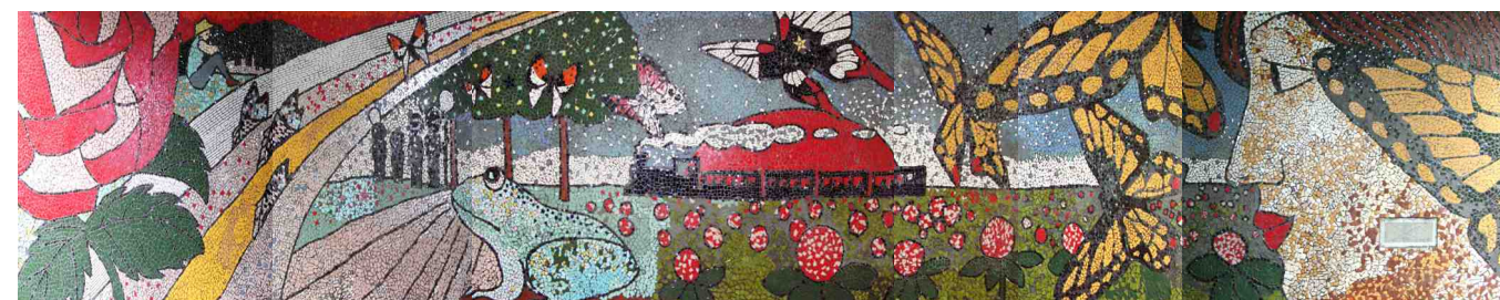
不思議で楽しい壁画が出来上がりました。タイトル：『私に繋がるすべてのものへ』