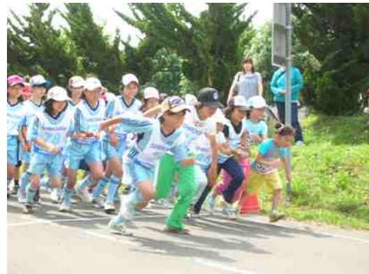
さっそうとスタートする子供たち

大会役員は、安全確認の為に走路員として、また、このリカバリセンターよりAED〔自動体外式除細動器〕を準備しての大会でした。