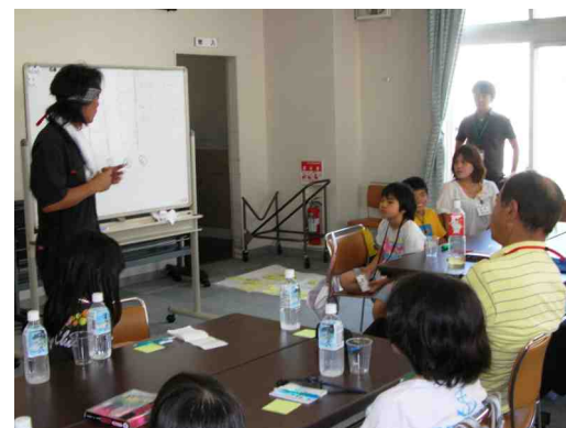
デザインワークショップ

昨年、サイクリングロードの『からまつトンネル』(南郷通17丁目南)の南側の壁に色あざやかな巨大とんぼのモザイク壁画が完成し、行き交う人から好評を得ていました。今年はさらに北側の壁に白石の幻想的な風景が加わり、両方の壁に壁画が完成し明るくてすてきなトンネルになりました。