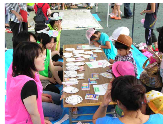
どんなお面ができるかな？(お面づくり)

最後に、今回お手伝いをいただいたスタッフの方、学生ボランティアの皆さん雨の中、最後までありがとうございました。