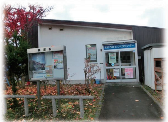
旧北白石まちづくりセンター