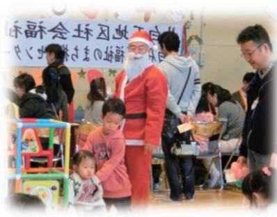
北白石社会福祉協議会