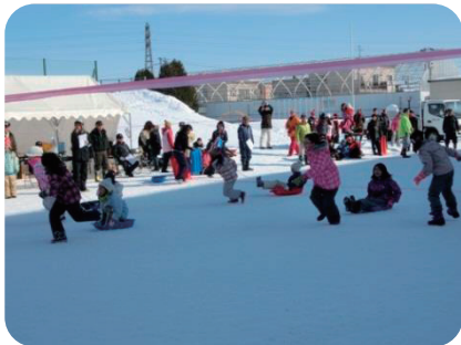
北白石連合町内会

北白石地区では、いろいろな団体がさまざまな活動を行っています。その一部を紹介します。