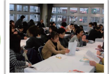
北白石体育振興会