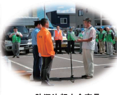
防犯決起大会宣言