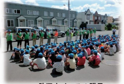
防犯ホイッスル贈呈