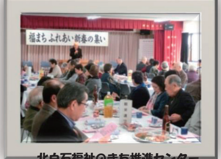
北白石福祉のまち推進センター