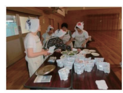
赤十字奉仕団北白石分団