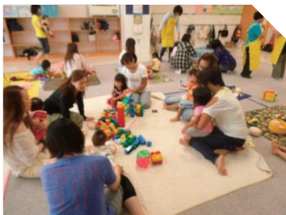
北白石地区民児協