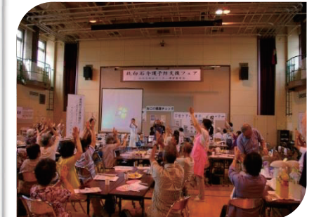
北白石地区センター