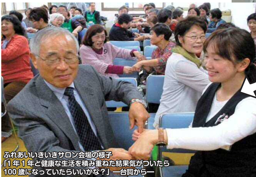
ふれあいいいきサロン会場の様子 「1年1年と健康な生活を積み重ねた結果気がついたら100歳になっていたらいいかな？」一台词から