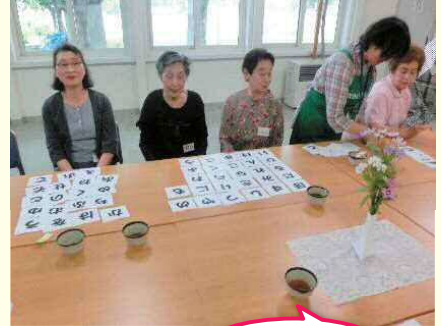
瑞穂会館 字合わせ