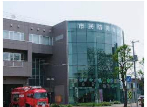
市民防災センター 白石区南郷通6丁目北

16年前、神戸市を襲った「阪神淡路大震災」は、大都市で起こった災害として私たちが大いに参考にすべきものです。あの時の死者6,443人のうち9割は瞬間圧死でした。この点から住宅の耐震化が急がれます。164,000人が家屋崩壊などで閉じ込められ、自力で脱出できた人を除く35,000人が閉じ込められたままでした。その人たちの約8割を救出したのは付近住民の人たちの力によるものでした。また、逃げ遅れた人たちの大半が高齢者や障がい者であったことから「自主防災組織」の育成が急務であるとされていますし、避難支援を必要とする対象者の把握がなされていないことが災害対策の反省材料として残りました。