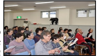
【皆さんも参加して合唱】

「挨拶・見守り運動」の経緯と現状についてをお話をさせて頂き、ご理解とご協力をお願い致しました。