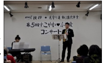
【素晴らしい演奏にうっとり】