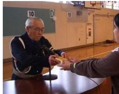
鷹架(たかほこ)実践会会長より委嘱状が渡されました。