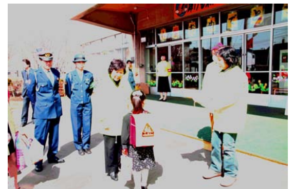
入学式当日ランドセルカバーが贈られる