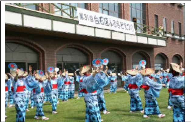
連合町内会婦人部の皆さんによる白石音頭