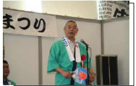
来賓挨拶 風間白石市長