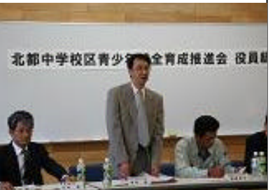
澤田北都中PTA会長の挨拶

今年の4校交歓音楽会は23回めとなり、11月10日に決まりました。北都中は今年水廻りの大規模改修が始まります。