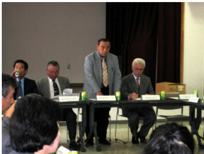
北都地区会館で開催された総会

さらに、地域の防犯、防災など安全で安心できる地域を目指した事業の立ち上げも予定しており、今後も幅広いまちづくり活動が期待されます。