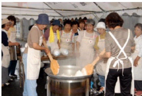
ボランティア活動の状況

赤十字の活動資金は、皆さまの善意の寄付で成り立っており、自治会や町内会の方々をはじめ、赤十字奉仕団等のご協力によって募集活動を進めています。