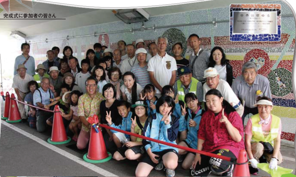
完成式に参加者の皆さん