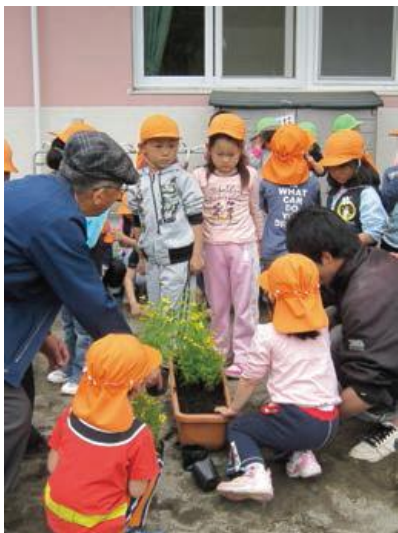
生花店による保育園での花育活動