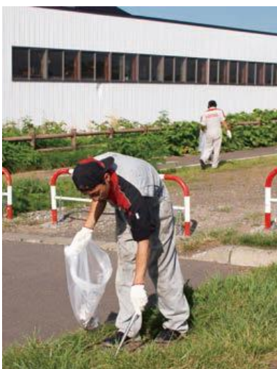
社員全員でのゴミ拾い