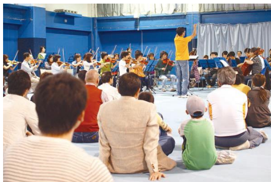
テニススクールによるテニスコートの地域イベントへの開放（写真は区オーケストラのコンサート）