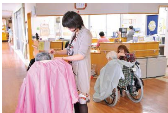
美容院による老人ホームへ出向いての無料ヘアカット実施