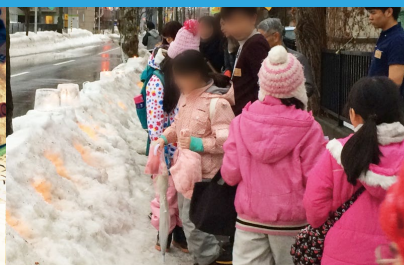
完成したキャンドルに子どもたちは大喜び!