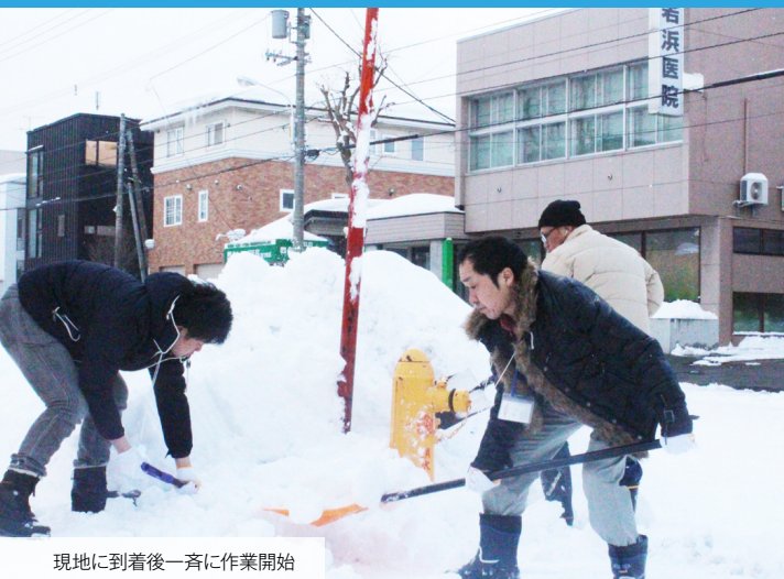
現地に到着後一斉に作業開始