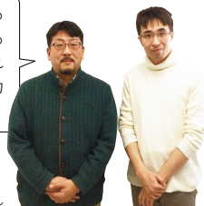
左)安細社長、右)森田さん

子どもたちの対応に慣れているNeolosさん、生物に関する知識を持つ弊社が、それぞれの強みを生かせたことが成功につながったと思います。