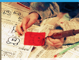
集まった約100人の子どもたちに上手な動物の描き方の講義