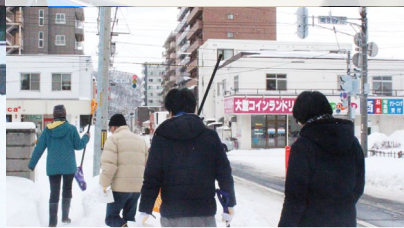
当日は晴天に恵まれ、大成功に終わりました