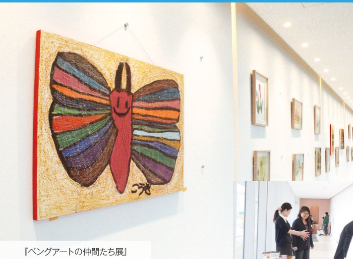
『ペングアートの仲間たち展』