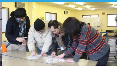
出発前に地区や注意事項の確認