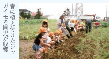
春に植え付けたジャガイモを園児が収穫

リサイクル堆肥を提供 体験農場の畑づくりに一役 食品工場などから収集した生ごみを自社で堆肥化し、農家に運搬・提供しています。平成22年には、この堆肥を施用した丘珠・北島農場の畑で、地元幼稚園の園児がジャガイモの栽培を体験。同社では「無理せず仕事の延長線上で、地域の活動に参画できれば」と考えています。