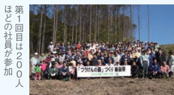
第1回目は200人ほどの社員が参加

社員参加型植樹活動「つうけんの森」づくり 300台前後の社用車を走らせていることから、環境保全のために何かしたいと考えた田原社長が、社内一斉メールで活動内容を募ったのが植樹活動の始まり。より多くの社員が参加し、楽しめるように、当日はレクリエーションを兼ねるなどの工夫をしています。