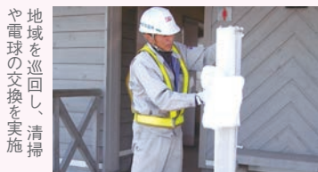
地域を巡回し、清掃や電球の交換を実施

工事現場の周辺地域にて 防犯灯や電灯を清掃・修理 「社業を通じて世間に貢献」を社訓とするエル電。地方での作業が長期にわたることがあり、休工日を使って工事周辺地域の防犯灯、バス停や公衆トイレの電灯清掃・修理、草刈りなどを行っています。「今後は札幌市内でも何か活動ができれば」と考えています。