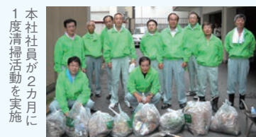
本社社員が2か月に1度清掃活動を実施

会社周辺の清掃活動を開始 冬期は転倒防止に砂散布も 「長く続けられることを」と考え、平成22年1月から豊平区アダプト制度に参加。地域住民とともに会社周辺道路沿いのごみ拾いを行い、冬場は自主的に地下鉄中の島駅周辺での砂まきを実施しています。活動は社員間のコミュニケーションの場にもなっているそうです。