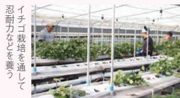
イチゴ栽培を通して忍耐力などを養う

ニートなどの若者に 働く機会・訓練の場を提供 札幌市からの打診がきっかけで、2年前から就労機会が得られない若者などを訓練生として受け入れています。彼らは5カ月間、イチゴの栽培から出荷に至る作業を経験。「短期間だが忍耐力や精神力を養い、ここで培ったことを次に活かしてほしい」というのが同社の思いです。