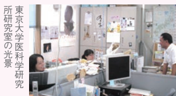
東京大学医学研究所研究室の光景

医薬・医療分野で産学連携 5つの大学に寄付講座設置 平成17年から総合大学の医学部にて寄付講座をスタート。全国5大学で7講座を実施するとともに、医薬に関する共同研究を行っています。同社では産学連携の取組を通じて、「医薬・医療の発展、次代を担う医療従事者の育成に寄与していきたい」と考えています。