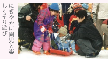
にぎやかに園児と楽しく遊び

保育園児と地域の親子が 遊ぶ場・つながる場を提供 保育園に通っていない子どもたちを園児と一緒に遊ばせたり、親同士の交流、保育士とのふれあいを図るなど、保育園を知ってもらおう活動に取り組んでいます。「地域との交流を大切にし、保育の現場から情報を発信して、子育てを応援できたら」というのが同保育園の思いです。