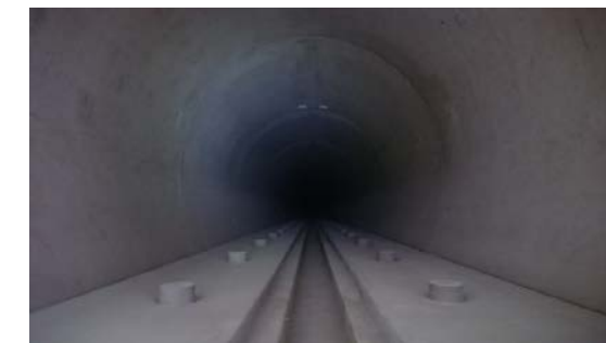
19.国縫トンネル他 坑内状況