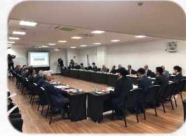
連絡協議会の様子

まちづくり構想の骨子や意見の概要等、会議の詳細については、市のホームページ（右記コード）からご覧ください。