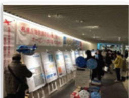
過年度のオープンハウスの様子

幅広い方々のご意見をいただくため、空港周辺地域のほか、市中心部での開催も検討しています。詳細は決まり次第ニュースレターでご案内いたします。