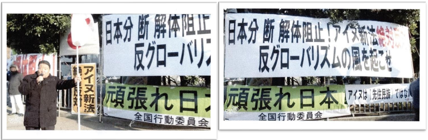
(CRAC NORHT 資料より引用)

水島総「北海道の私たちの祖先の縄文文化の一部族としてアイヌはいた、生活程度は非常に低かった、明治のころですら新石器時代の生活に甘んじなければならない、そのアイヌに旧土人保護法でアイヌに教育を施し農業を教えなんとか自立した暮らしができるように、[和人は]北海道を作り上げてきた。」「国民の祖先を、アイヌを虐殺し土地やさまざまなものを奪ったとして区別する、先住民という言葉はまさに[日本人を]差別するともない法律である。」「アイヌ民族の認定する機関がある、その事務局長の方はなんと自分がアイヌでないことをはっきりいっている。同和系の方だといっている。」「まさに過激派の言っているアイヌ独立論、まさに中国共産党の在日工作の一環としてアイヌの問題がおきている。アイヌ新法を推進する人たちは自民党の中に二階派という親中派がいて、同じ流れのなかで菅官房長官も中国共産党が望むような流れに変えていくなかで、アイヌ新法が推進されていく。」「(日本文化チャンネル桜代表取締役社長、頑張れ日本!全国行動委員会幹事長、朝日新聞を糾す会事務局長、国守衆・全国議長)「CRAC NORTH アイヌヘイトの特徴と例 2021. 8. 23」から引用