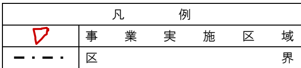
図 1-1 事業実施区域位置図

※この地図は、国土地理院発行の5万分の1地形図(札幌市、石山)を使用したものである