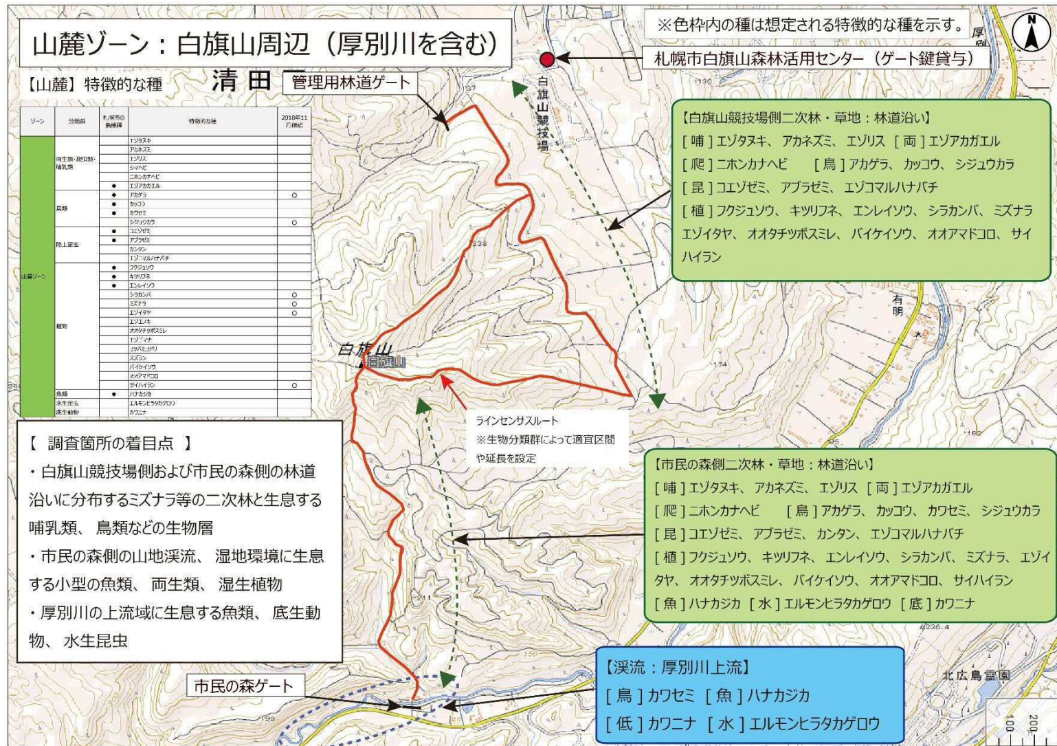
調査地区図2 白旗山周辺