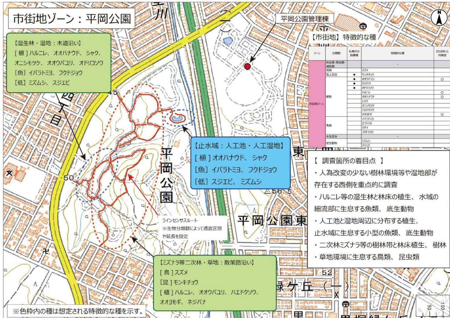
調査地区図3 平岡公園