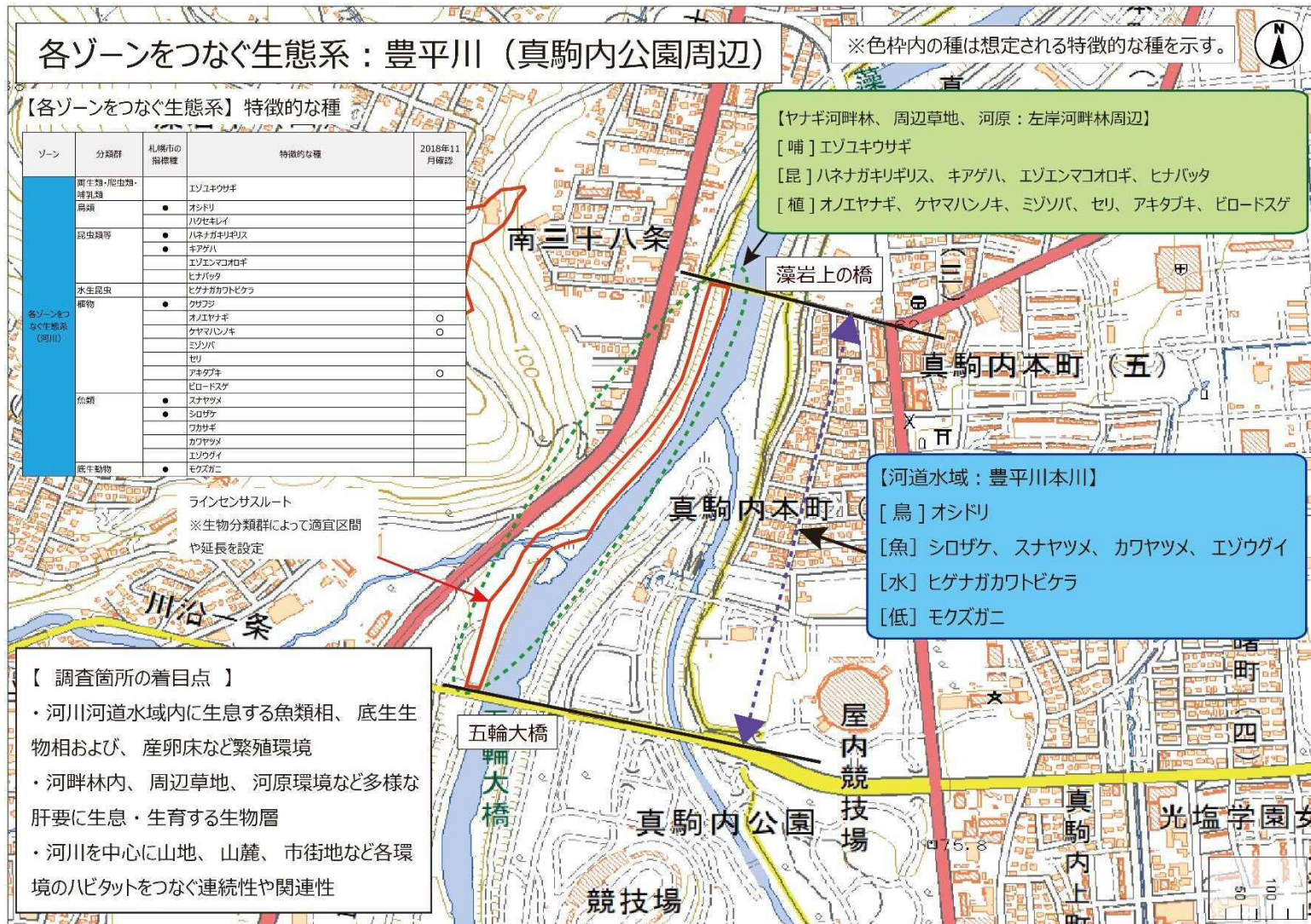
調査地区図5 豊平川